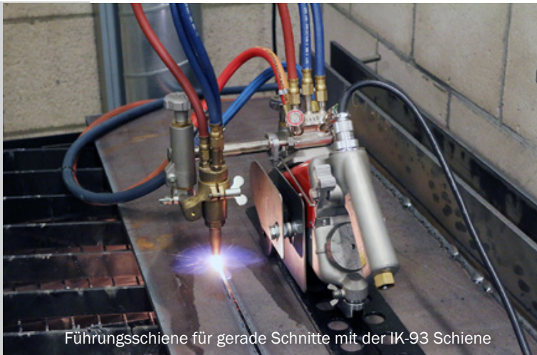
Führungsschiene für gerade Schnitte mit der IK-93 Schiene