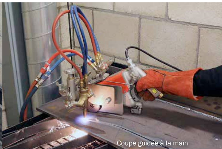
Coupe guidée à la main

La IK-93T Hawk est une machine de coupe portable conçue principalement pour les besoins de coupe en ligne rectiligne et guidée à la main de haute qualité. En plus de faciliter une haute qualité de coupe, elle permet un fonctionnement régulier et une mobilité sans précédent.